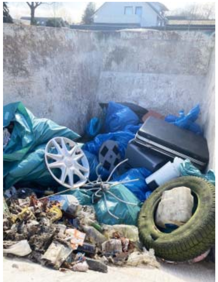
Sammelaktion 2023