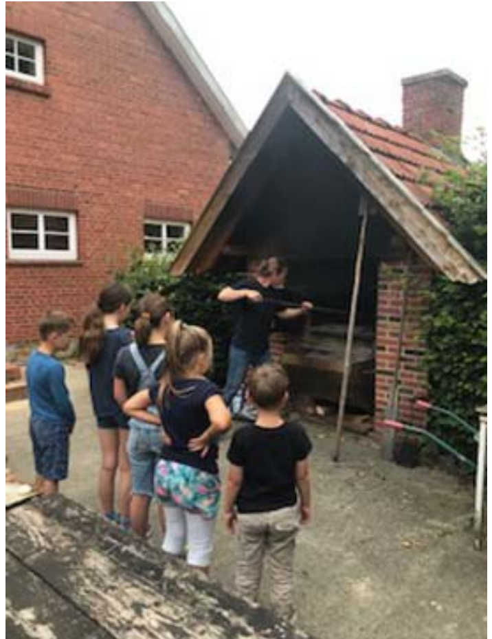
Bericht: Anke Marks

Gemeinsam wurde dann draußen in der Natur gegessen, denn eine selbstbelegte Pizza schmeckt jedem und auch beim Salat wurde gut zugegriffen. Zum Abschluss ging es noch auf den Spielplatz, wo sich die Kinder austobten, bevor wir die Heimreise antraten.