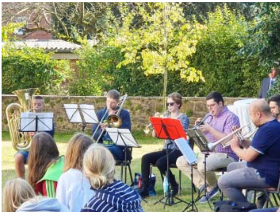
Foto vom Einführungsgottesdienst von Pastorin Hilker (S. Große Dartmann)

Kommen Sie vorbei und wenn Sie mögen, singen Sie mit. Gegen die kalten Temperaturen wird Punsch gereicht.