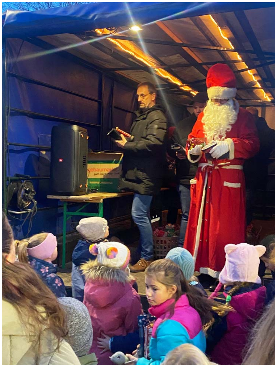
Der Nikolaus verteilt mit Unterstützung des Orga-Teams die gefüllten Stiefel auf dem Weihnachtsmarkt.